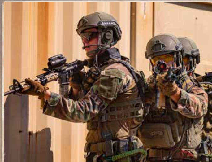
Fusil de Asalto (M4A1) / PF (3) / B/E (4/7) Lanzagranadas (Fusil) / Área / B/E (3/8)