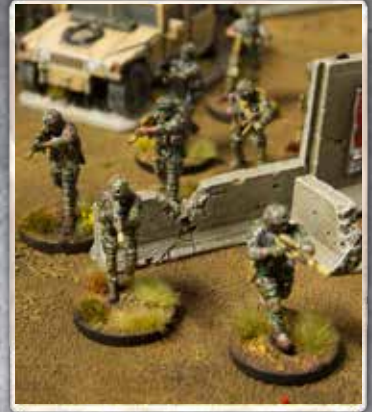
Fusil de Asalto (M4A1) / PF (3) / B/E (4/7)

Some may call them contractors, others mercenaries, or perhaps war junkies, but one thing is certain: they are soldiers who have served in the finest units of their armies, possess elite military training, and know what it's like to fight in a war. Always ready to operate under the harshest conditions or take on the jobs no one else wants to handle, they now choose to work for those willing to pay their fees. ♦ Algunos los llamarán contratistas, otros mercenarios o quizá yonkis de la guerra, pero lo que es seguro es que son soldados que han servido en las mejores unidades de sus ejércitos, que tienen un entrenamiento militar propio de unidades de élite y que ya saben lo que es pelear en una guerra. Siempre dispuestos a pelear en las peores condiciones o a hacer las tareas que nadie quiere hacer ahora deciden trabajar para aquellos que paguen sus honorarios.